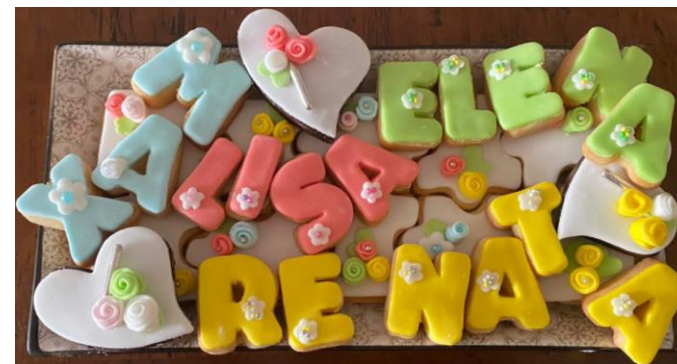
Corsi di pasta fresca e decorazione biscotti